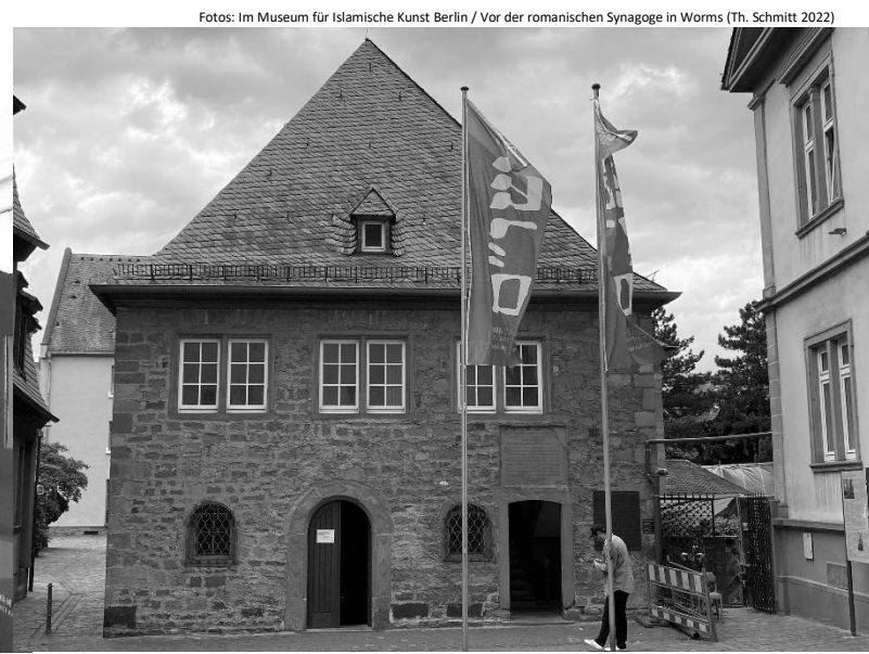
Fotos: Im Museum für Islamische Kunst Berlin / Vor der romanischen Synagoge in Worms